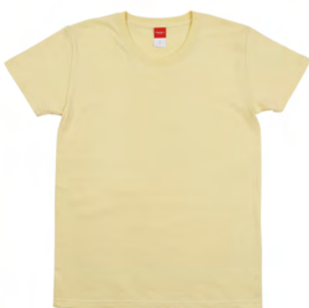
ウィメンズサイズ

定番のアメリカンスタイルの素材やディテールをモダンにアレンジしたユニフォームサーカスビームスオリジナルTシャツです。程よい厚みの5.0ozの素材で着心地を追究したベーシックスタイルです。襟ぐりや袖周りが女性らしいシルエットのウィメンズサイズも用意しています。